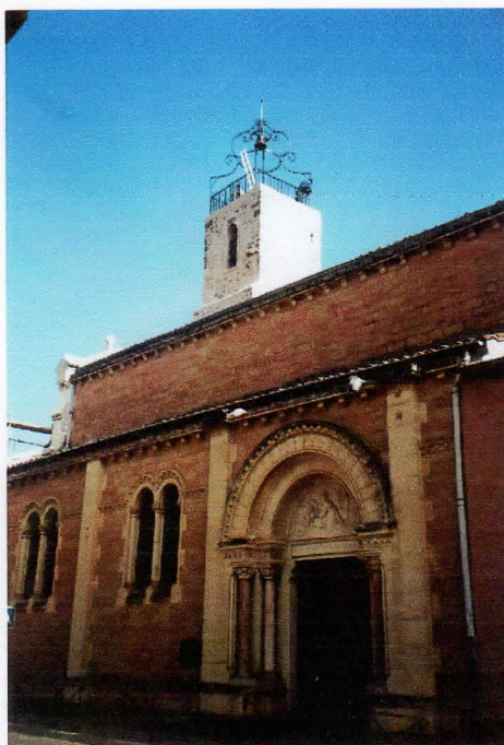
Le campanile au dessus de l'église vu depuis le portail d'entrée

Une dernière touche pour figurer le campanile fut la fixation du drapeau tricolore. Ce qui fut fait quelques jours plus tard. À vrai dire, ce ne fut que la remise en place du symbole de la République, mais sur un nouveau support repeint aux couleurs de la France. En effet, il n'est pas en toile ou en tissus mais en tôle rigide. Aussi se comporte-t-il comme une girouette puisqu'il s'oriente mollement au grès du vent. La proximité du clocher de l'église lui donne ce cachet mi-religieux, mi républicain.