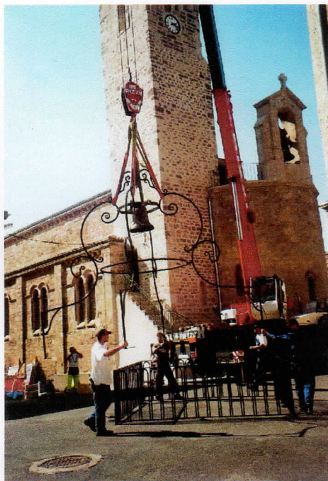
Assemblage du campanile et de la rampe

reporter. Sur les trente-trois qu'elle m'a montrées, j'en reproduis quelques-unes. L'une d'elles montre le campanile sur le point d'être posé, assemblé sur la rampe.