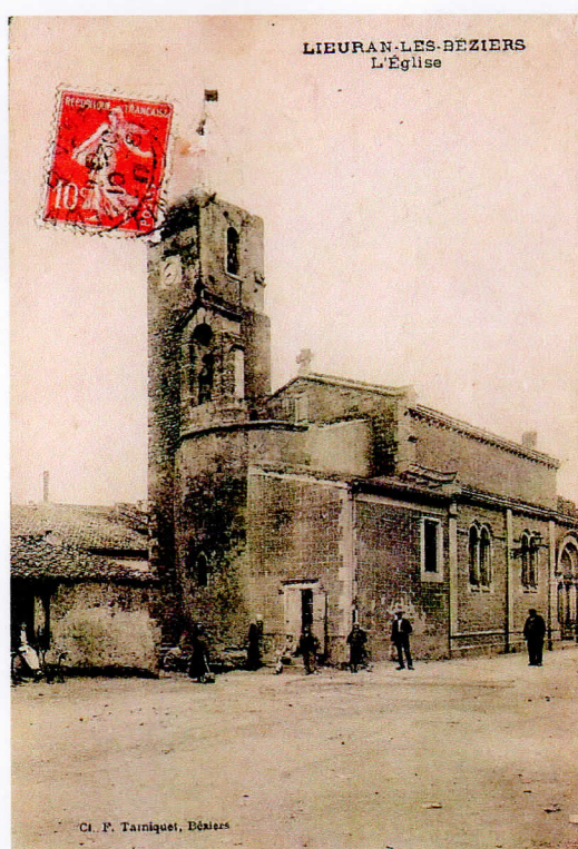
datée de 1912

Je n'ai pu que remonter au début du siècle dernier. D'après une carte postale, adressée en 1912, le drapeau flottait déjà de sa perpétuelle rigidité, comme s'il prévoyait qu'il résisterait à toute tempête.