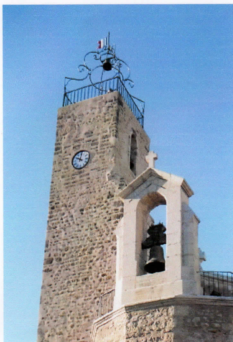
Vue actuelle du campanile surplombant le clocher de l'église

Une dernière touche pour figurer le campanile fut la fixation du drapeau tricolore. Ce qui fut fait quelques jours plus tard. À vrai dire, ce ne fut que la remise en place du symbole de la République, mais sur un nouveau support repeint aux couleurs de la France. En effet, il n'est pas en toile ou en tissus mais en tôle rigide. Aussi se comporte-t-il comme une girouette puisqu'il s'oriente mollement au grès du vent. La proximité du clocher de l'église lui donne ce cachet mi-religieux, mi républicain.