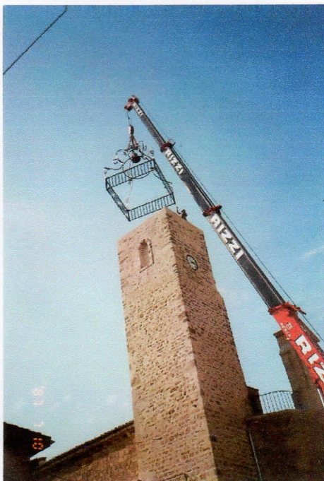
Élévation de l'ensemble du campanile, sur le point d'être posé sur le beffroi

L'envol d'une telle œuvre d'art s'est ensuite effectué à l'aide d'une immense grue. J'aurais aimé être présent lors de l'élévation de l'ensemble rampe-campanile qui fut ensuite délicatement posé, puis fixé pour résister au vent, aux tempêtes.