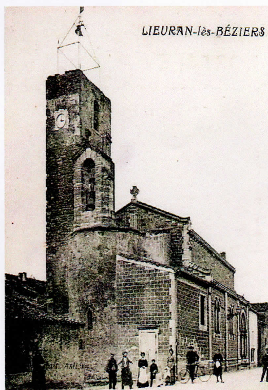
Vue du beffroi avec l'ancien campanile

Toutes les tours ne sont pas surmontées d'un campanile en maçonnerie. Ainsi que je l'ai relevé, leur sommet est parfois en fer forgé. Alors que le campanile de Lieuran sur la photo de 1912 est d'une grande simplicité, peut-être trop, sa réfection ne date que de mars 2007. La vétusté du beffroi valait bien sa rénovation. La municipalité s'engagea donc dans le remplacement de l'ancien campanile.