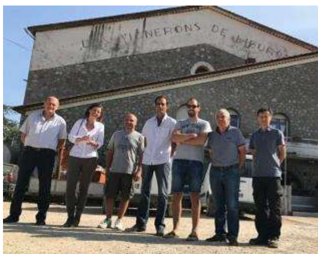
Notre députée, Emmanuelle MÉNARD, en visite à la cave coopérative, le 6 septembre.

De plus, le mois d'août est un mois de vacances, nous avons rencontré des problèmes de recrutement de personnels saisonniers. Pour la durée des vendanges, nous employons environ 20 personnes sur différents postes plus ou moins techniques.