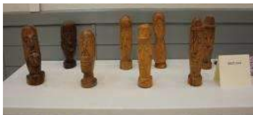
Stand Aimé BARDY