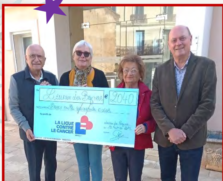
Ligue contre le Cancer 18 et 19 Octobre 2025 2 040€ reversés

En présence des autorités civiles militaires, des anciens marins et anciens combattants, la remise des bonnets « bâchis » a été effectuée à l'attention des stagiaires de la promotion 2025-2026 de la préparation militaire marine.