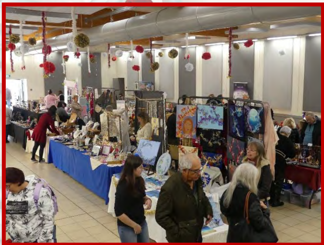
Foyer Rural 30 Novembre 2025