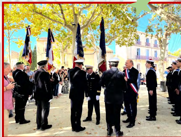
Remise des « Bâchis » 11 Octobre 2025

En présence des autorités civiles militaires, des anciens marins et anciens combattants, la remise des bonnets « bâchis » a été effectuée à l'attention des stagiaires de la promotion 2025-2026 de la préparation militaire marine.