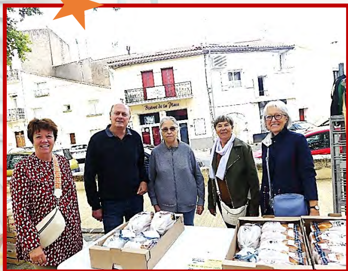
Vente des Brioches Du 03 au 06 Octobre 2025 336€ collectés au profit de l'APEAI