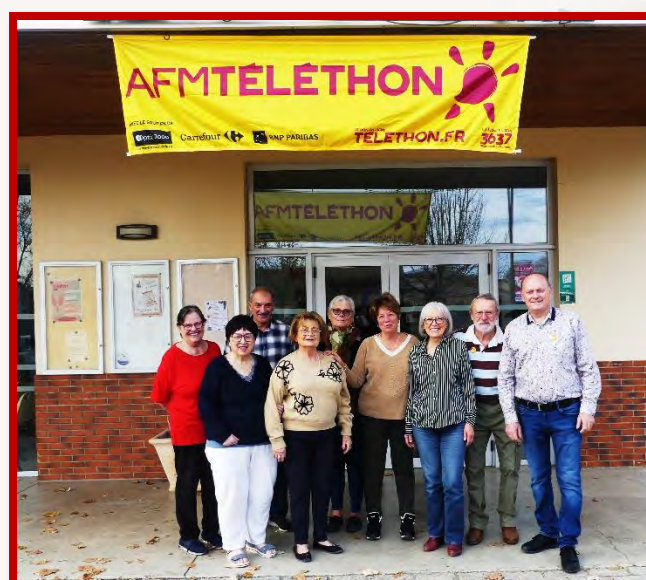
Téléthon 5, 6 et 7 Décembre 2025 1 974.26€ reversés

Un grand merci aux associations, bénévoles, donateurs et participants à ces deux manifestations caritatives que nous organisons chaque année et qui permettent d'aider la médecine à progresser.