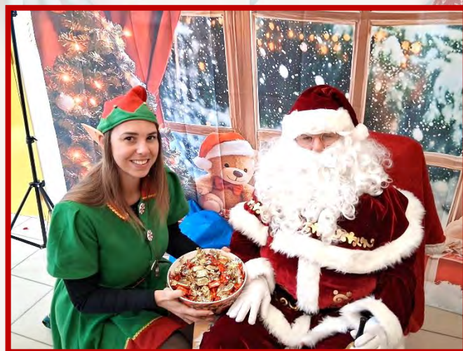
Ecole - APE 06 Décembre 2025